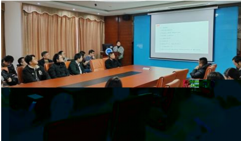
图 员工专业技能培训

2023 年，公司 促 进 发 展 和 才 方 得 成 功。 通 过 创 新 的 和 不 动 公 司 的 持 续 成 长， 工 供 应 的 发 展 机 会。 通 过 供 多 样 化 的 和 发 展， “ 队 队 共 建 ” 等 活 动 ( 4-5)， 帮 助 工 技 术 和 管 理； 并 通 过 的 和 规 划， 工 的 合 作 和 包 导 发 展 计 划、 技 术 及 部 等， 地 促 进 工 的 方 发 展。