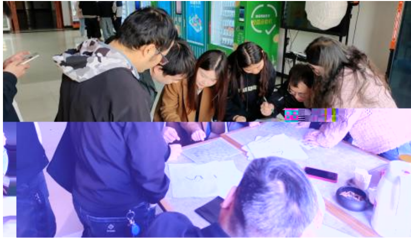
图 卓越团队建设共识营