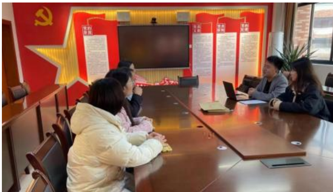
图 校企开展学术研讨项目交流会议

公 高度 队的 ，充分 到 和 的关 ，对 高 和 关 的 。此公 供 ，包 更 、 方法 及 导 发 程，并 持 丰富 的 家 过 、 会和 际案 ， 队 分 划的 和 。 常 地 活动， 包 参加 会 、 等 ， 促 的 的 分 ， ， 并 的 队 ( 1)。